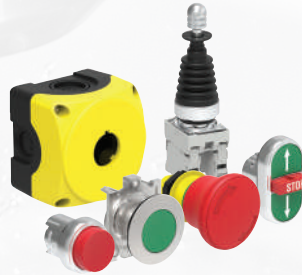
Befehls- und Meldegeräte