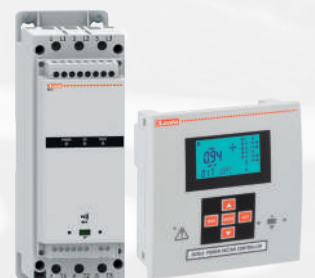
Blindleistungsregler und Thyristormodule