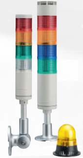
Signalsäulen und Leuchtmelder