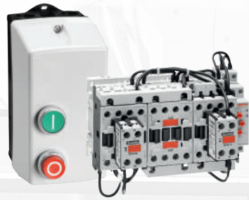
Elektromechanische Motorstarter und Gehäuse