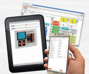
Software und Anwendungen