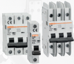
Leitungs-, FI-, FI-/LS-Schutzschalter