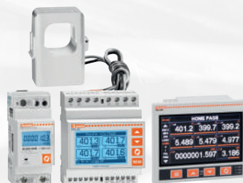
Messinstrumente und Stromwandler