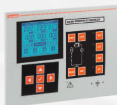
Generator- und Motorsteuerungen