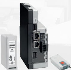
Erweiterungsmodule und Zubehör