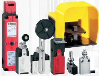
Positionsschalter, Mikroschalter und Fußschalter