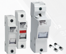
Sicherungshalter und Sicherungen